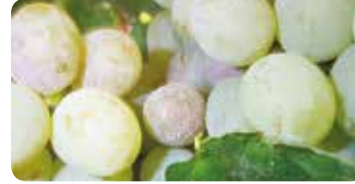
Bağ Küllemesi ( Erysiphe necator )