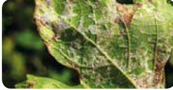
Bağ Mildiyö ( Plasmopara viticola )