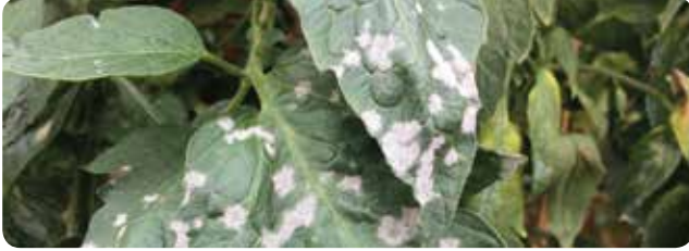
Domates: Patlıcangillerde Külleme ( Leveillula taurica )

Uygulama zamanı: Domateste külleme: İlk hastalık belirtileri görüldüğünde uygulamalara başlanır. Hastalık şiddetine göre 10-14 gün ara ile ilaçlamalara devam edilir.