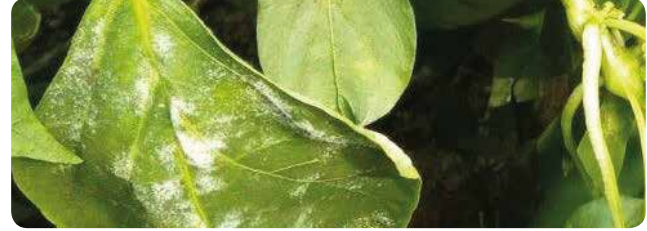
Biber: Patlıcangillerde Külleme ( Leveillula taurica )