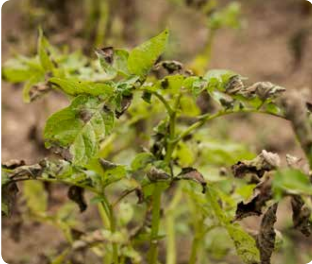
Patatete Mildiyö Zararı ( Phytophthora infestans )