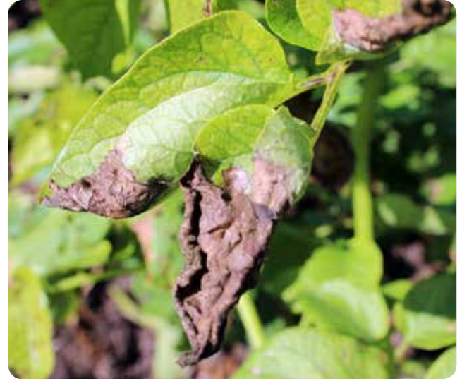
Patatete Mildiyö Zararı ( Phytophthora infestans )