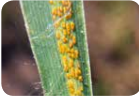
Buğdayda Sarı Pas ( Puccinia striiformis )