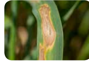
Septorya Yaprak Lekesi ( Septoria tritici )