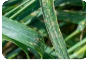
Buğdayda Tahıl Küllemesi ( Erysiphe graminis )