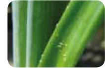
Tütün tripsi ( Thrips tabaci )