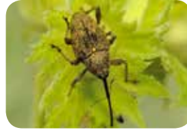
Fındık Kurdu - Ergin ( Curculio nucum )

Uygulama Zamanı: Fındık kurduna karşı meyvelerin mercimek iriliğine geldiğini dönemde yapılan kontrollerde 10 ocakta 2'den fazla fındık kurdu görülmesi durumunda uygulama yapılır.