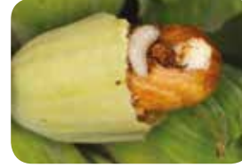
Fındık Kurdu - Larva ( Curculio nucum )